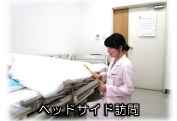
ベッドサイド訪問