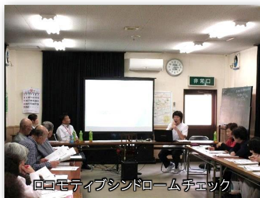
ロコモティブシンドロームチェック