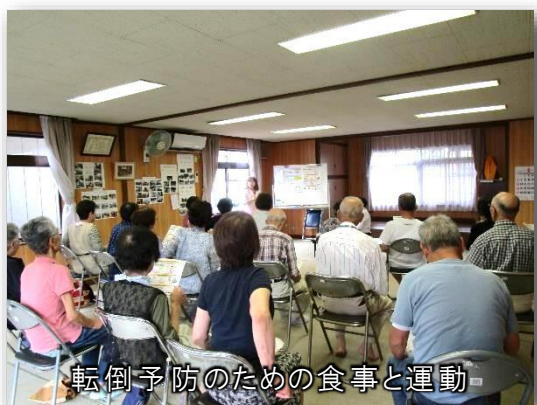
転倒予防のための食事と運動